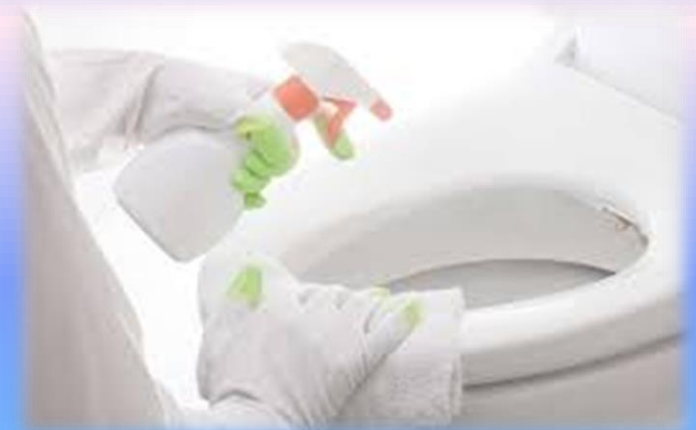
Désinfection continue des toilettes