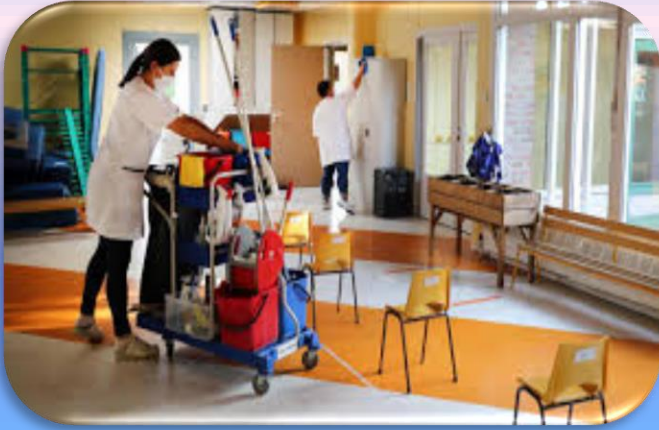
Désinfection quotidienne des locaux