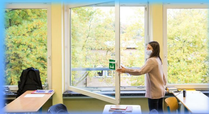
Aération continue des classes